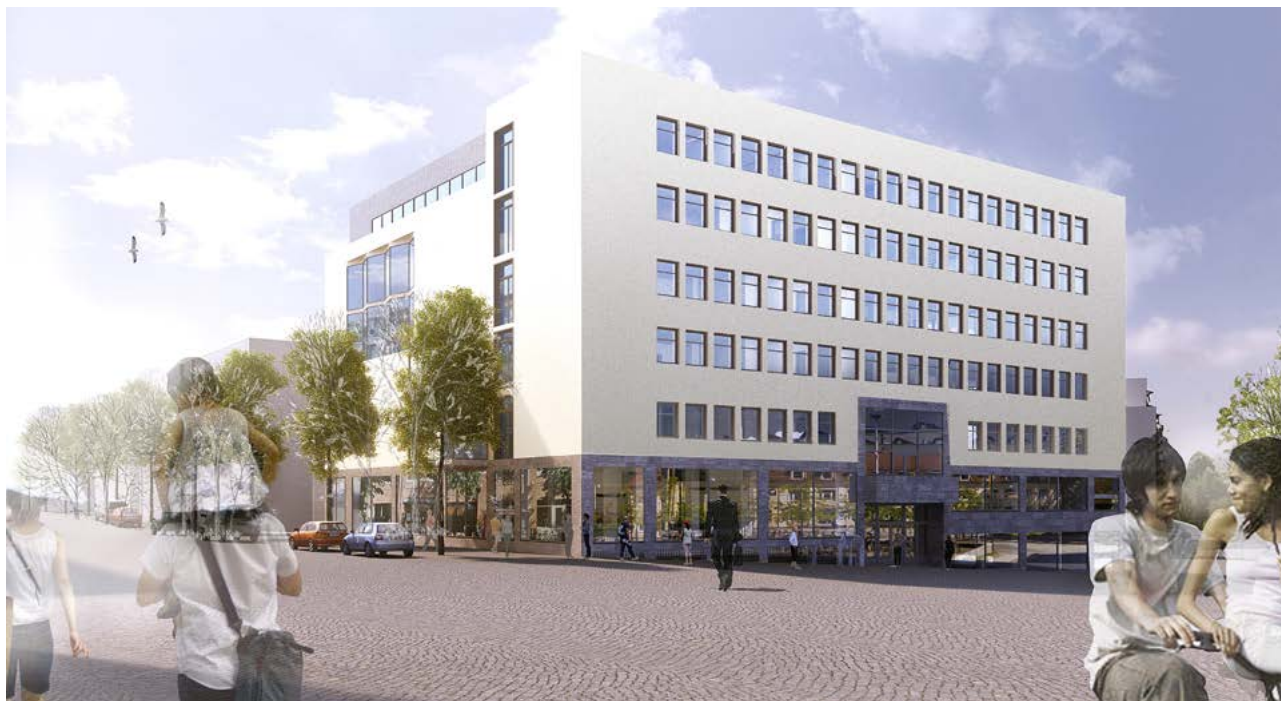
Förslag på utseende av Borås Kongresscenter. Bildmontage Tengbom.

Borås Kongresscenter som förväntas stå klart för inflyttning hösten 2016 ligger nu för behandling hos Industribyggnader i Borås AB.